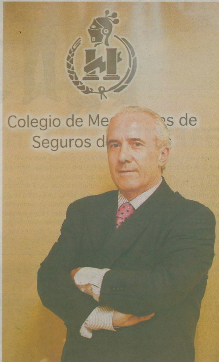
COMPANIAS. MANZANO RECUERDA QUE TODAS CUENTAN CON ELLOS.

Desde el Colegio de Mediadores de Seguros de Burgos somos conscientes de la importancia que tiene la figura del agente de seguros y la necesidad de apoyo para su gestión. En todo momento se