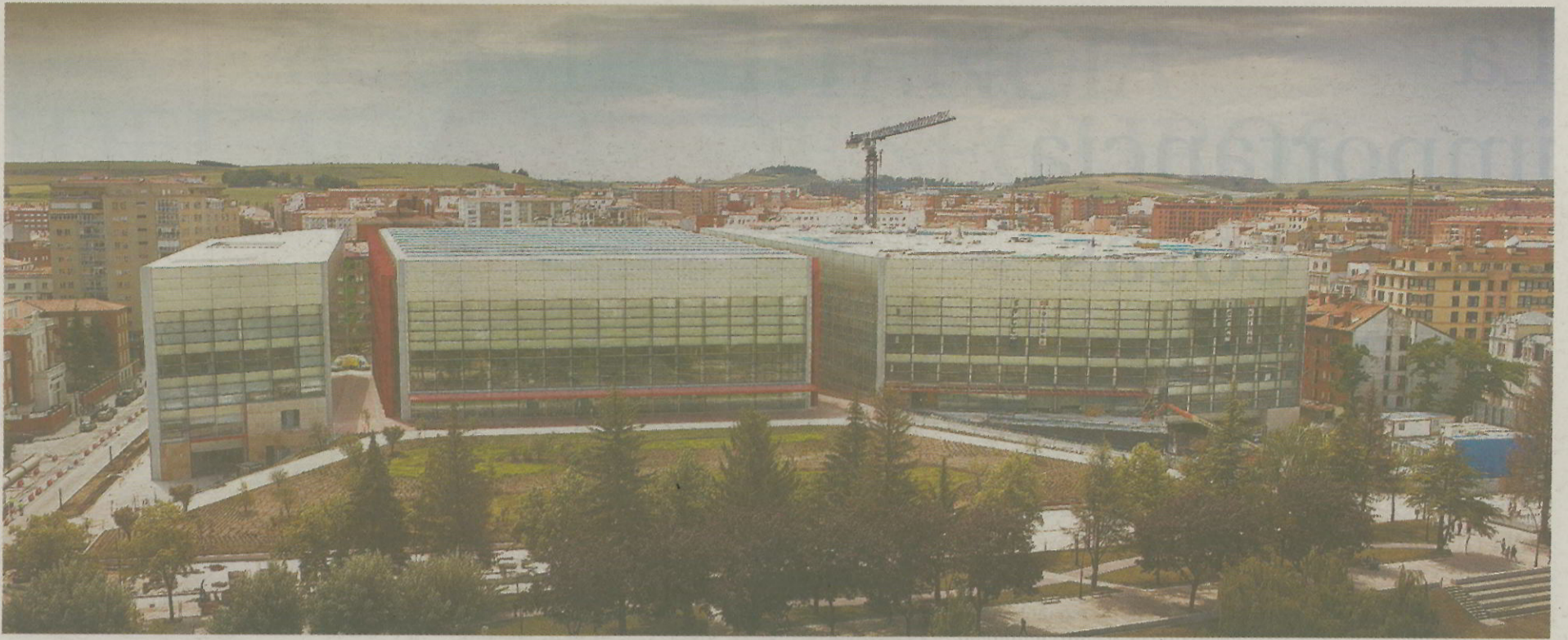
EL LUGAR. LA IMPORTANCIA DEL ESPACIO QUE ACOGERÁ EL ENCUENTRO -EL COMPLEJO DE LA EVOLUCIÓN- ES TAL, QUE HA INSPIRADO EL LEMA Y EL LOGO DEL CONGRESO.